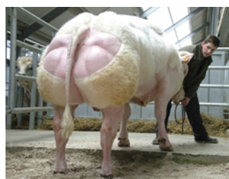
Harpon de l'Orgelot