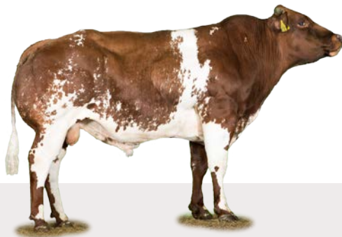
LATORRO VD JACOBUSHOEVE (Gontinus x Noek)

Ook dat is waar BETTER COWS | BETTER LIFE voor staat.